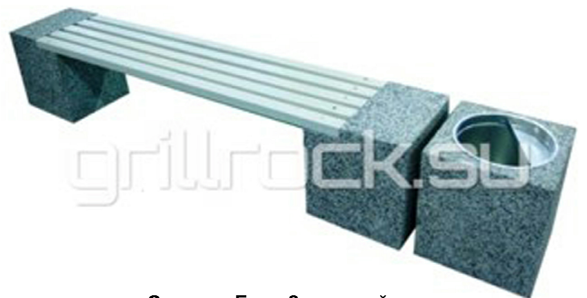
Скамья «Евро 2» с урной