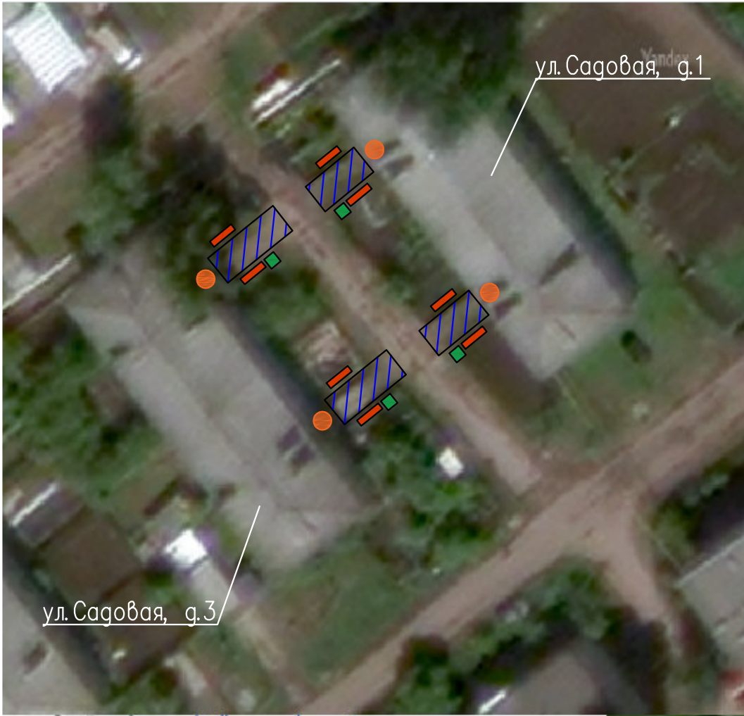
сп. Просвет, п. Просвет

Проектом предусматривается благоустройство территории п. Просвет, ул. Садовая, д.1, д.3 которое включает в себя: – устройство асфальтового покрытия входов в подьезды; – устройство освещения; – установка урн; – установка скамеек.